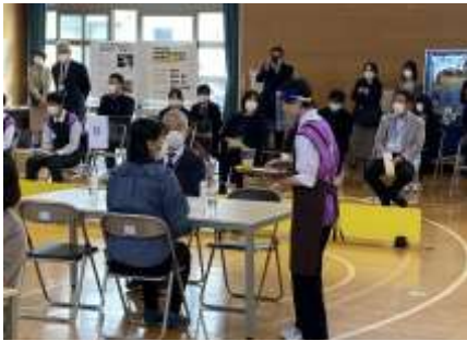
【喫茶サービス部門】